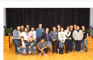
POR PRIMER VEZ EN INTERCOM