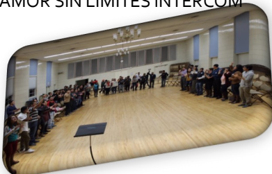
AMOR SIN LIMITES INTERCOM